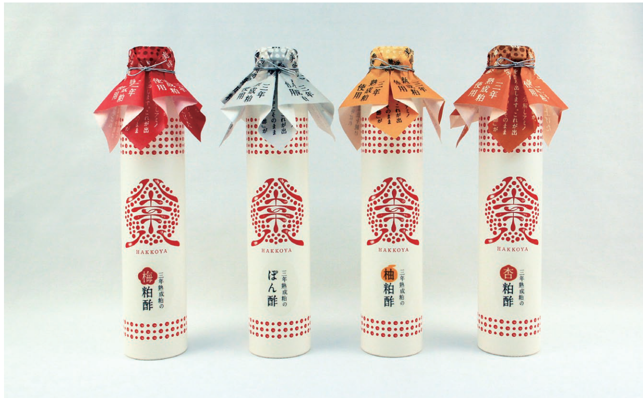
八幸八 粕酢飲料とぼん酢

八幸八（はっこうや）は発酵食品を中心にした商品販売と食事の店。100年以上続く大和屋守口漬総本家が母体です。漬物は年配客が中心ですが若年層にも発酵食品の良さを伝え漬物に親んでもらうため展開を開始。ロゴの赤い丸は発酵をイメージしています。写真は八幸八の商品・粕酢飲料とぼん酢です。プラスチックをなるべく