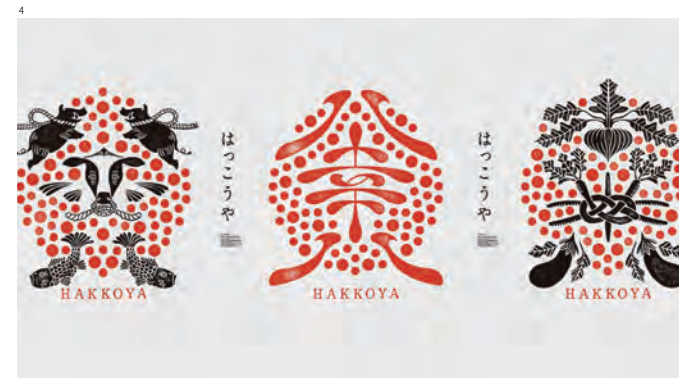
1~4 八幸八 cd. ピースグラフィックス ad.d. 平井秀和 d.copy.n. 瀬川真矢 cl. 大和屋守口漬総本家