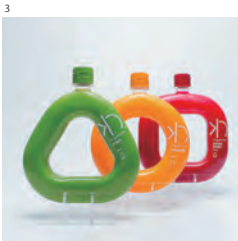
3 Aspac Awards 2017 [銀賞] 「わ」 d. 尾崎友梨