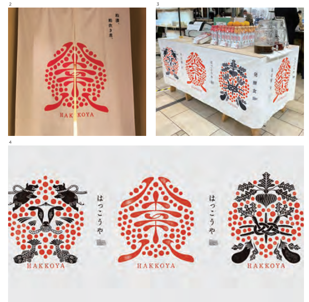
2 八草八 cd. ピースグラフィックス ad. d. 平井秀和 s. copy 丸 澤川真矢 cl. 大和屋守口漬総本家