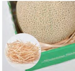
1 美吉野ファーム メロンパッケージ ad&d: 三原美奈子 const. 中野木型製作所 cl. 美吉野ファーム