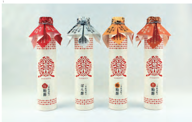
1 八幸八 粕酢飲料とぼん酢

八幸八（はっこうや）は発酵食品を中心とした商品販売と食事の店。100年以上続く大和屋守口漬総本家が母体です。漬物は年配客が中心ですが若年層にも発酵食品の良さを伝え漬物に親しんでもらうため展開を開始。ロゴの赤い丸は発酵をイメージしています。写真は八幸八の商品・粕酢飲料とぼん酢です。プラスチックをなるべく