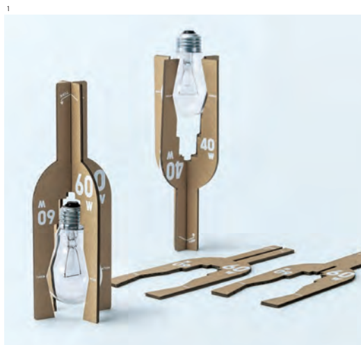
1 日本パッケージデザイン学生賞 2022 [大賞] 「高齢者のための手の届く電球」 d. 中野亜美