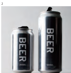
2 Aspac Awards 2019 [大賞] 「Stop Drunk driving」 d. 山田智晴