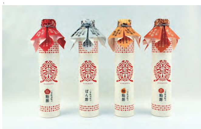
1 八草八 粕酢飲料とぼん酢

パッケージデザイン作品はもちろん、パッケージデザインに関する幅広い領域の仕事を紹介してください。ブランディング事例、什器デザイン、プロモーション、新聞発品、新技術、ワークショップ、セミナー、展覧会、コンセプト試作品など。