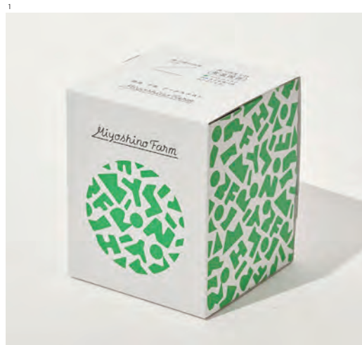
奈良県吉野郡の美吉野ファームのメロン用ギフトパッケージです。ひとつの箱で店頭のディスプレイにもなり、配送も可能な構造を考えました。地元吉野杉の割り箸のカンナ屑をアップサイクルし、緩衝材として使用しています。