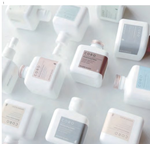
1. CORO 200 SERIES

ゴミにならない究極の Eco! 使用後はナチュラルテイストなアロマディフューザーや一輪挿しなど、さまざまな使い方でアフターユースできます。 高級感のある珪硝子だから、いつまでも置いておきたい上質なボトルです。