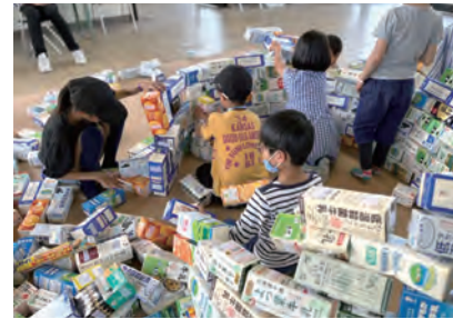
pr. 古谷晃一郎 ad&d. (Label) 佐藤浩二 (COSYDESIGN ) ad&d. (Package) 三原美奈子 ca. 西村佳子 cl. シビスおくむら

大阪府和泉市のプロジェクト。久保記念ミュージアムタウン構想のもと、和泉市の地酒づくりに地域の方とコラボレーションして制作しました。和泉市の久保記念美術館には歌川国芳が描いた浮世絵「荷宝蔵壁のむだ書」(浮世絵を描く前のラフスケッチ)があり、その中に描かれている「大できねこ」から「和泉・大でき」と名付けられました。この「むだ書」を瓶装紙にもデザインしています。